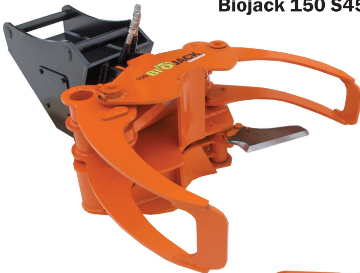
Biojack 150 S45